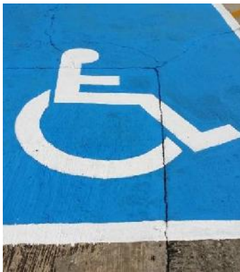
1.90 x 1.60 .